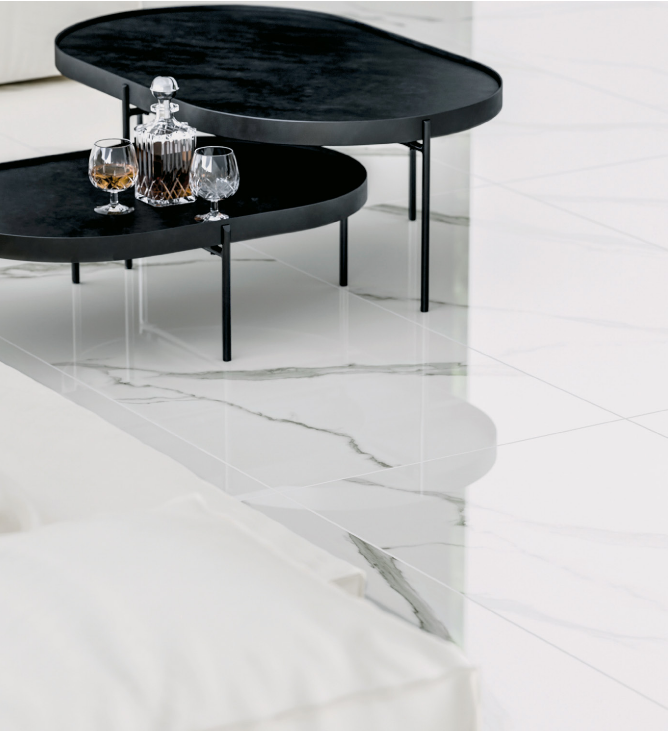
statuario poler 60x120 /rektyfikowana/