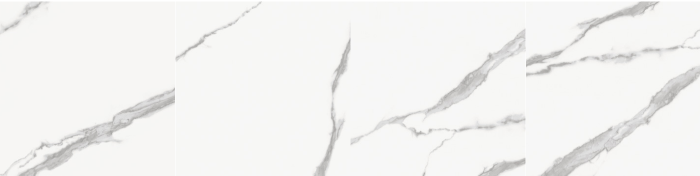
statuario 60x60 rektyfikowana