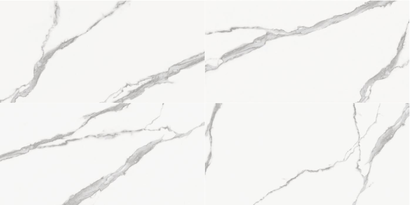
statuario 60x120 (rozmiar nominalna)rektyfikowana