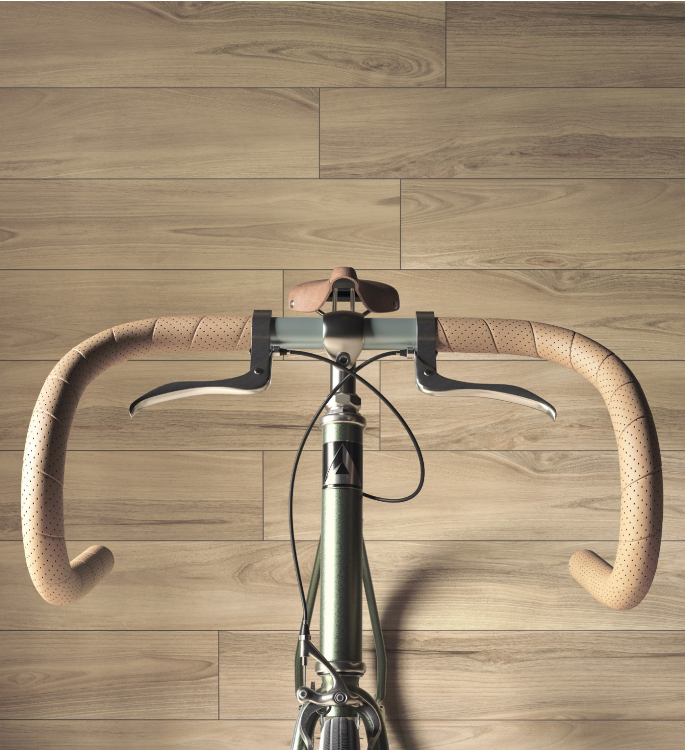
dreamwood 20x120 /rektyfikowana/