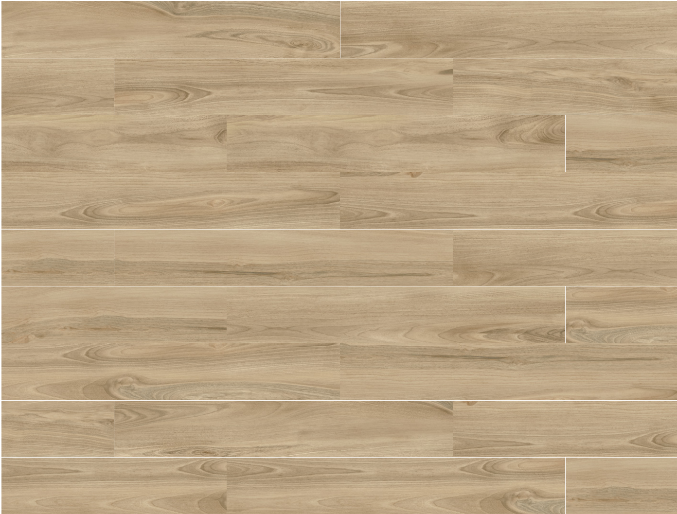
dreamwood 20x120 rektyfikowana